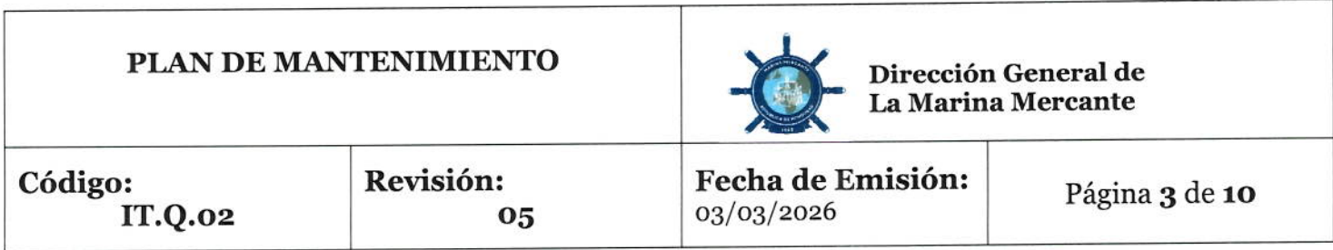
DIAGRAMA DE MANTENIMIENTO PREVENTIVO Y CORRECTIVO